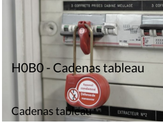
HOB0 - Cadenas tableau