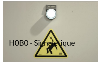
HOB0 - Signalétique