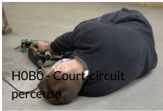
HOB0 - Court-circuit perçuse