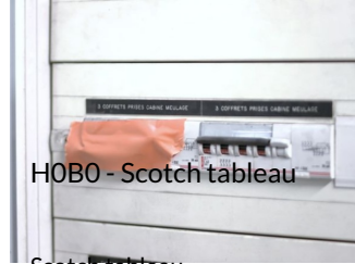
HOB0 - Scotch tableau