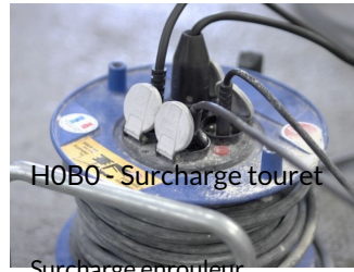
HOB0 - Surcharge touret