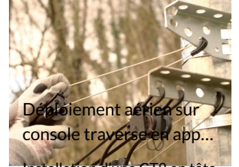
Déplioement aérien sur console traverse en app...