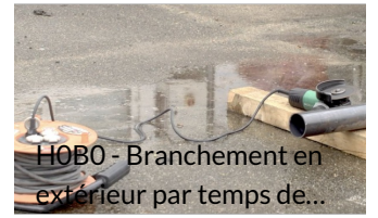
HOB0 - Branchement en extérieur par temps de...

Branchement en extérieur par temps de pluie